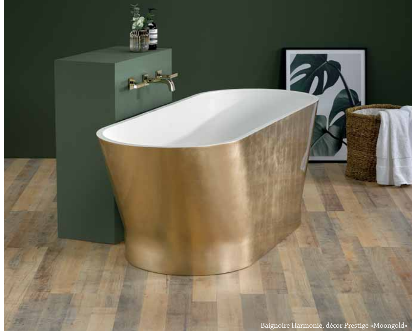
Baignoire Harmonie, décor Prestige «Moongold»