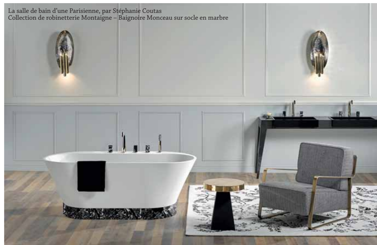
La salle de bain d'une Parisienne, par Stéphanie Coutas Collection de robinetterie Montaigne – Baignoire Monceau sur socle en marbre

Alors que la salle de bain devient indéniablement une pièce à vivre, objet d'attention et résolument décorative, c'est avec naturel et créativité que THG Paris développe, en parallèle de son cœur de métier, des produits de diversification ; proposant ainsi des écrins luxueux à l'image de la Maison.