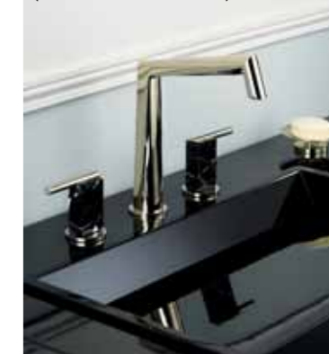
Collection Montaigne, en marbre Grand Antique et laiton (croisillon ou manette)