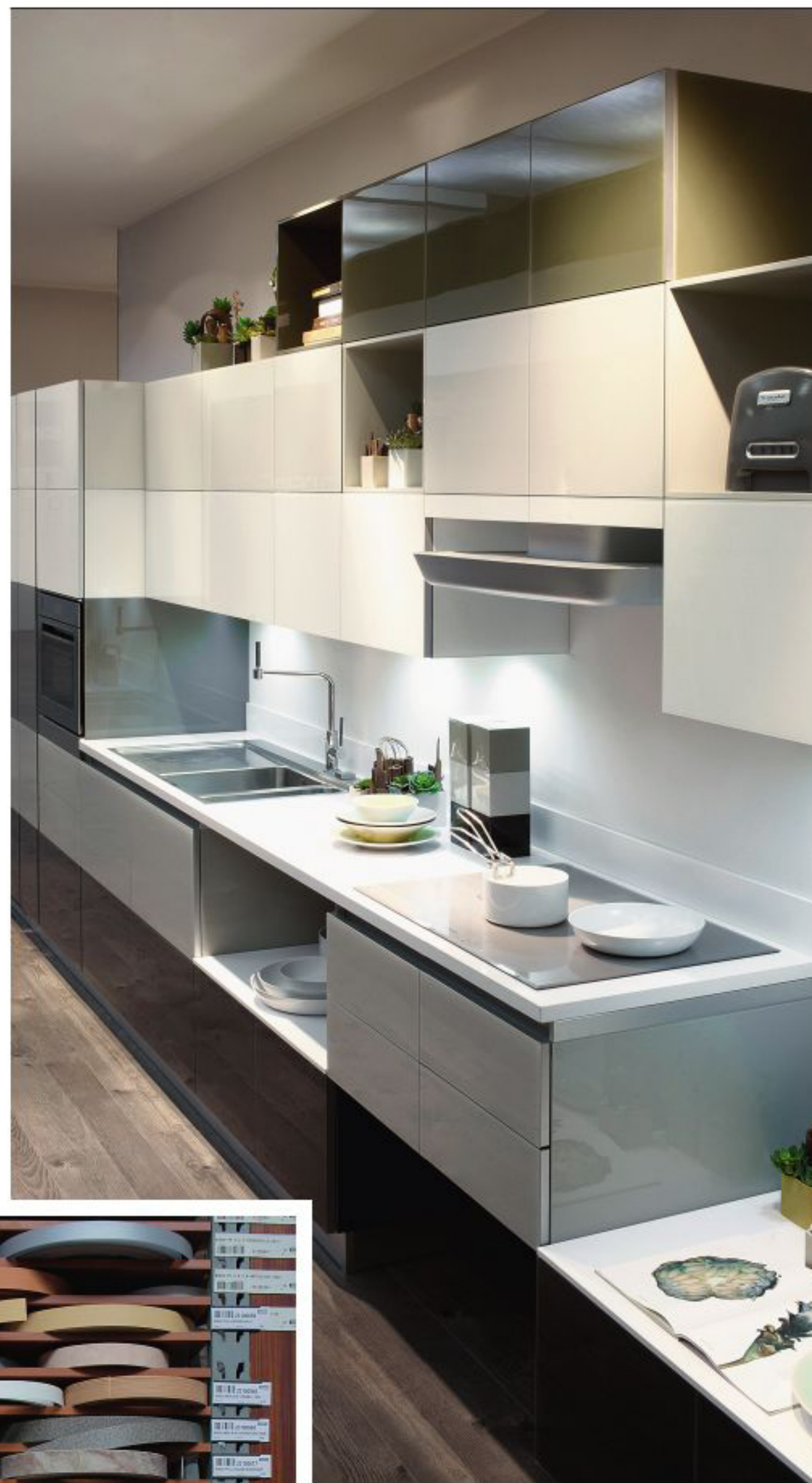
Вверху: кухня Tetrix.

Кодовые наклейки на кухонные элементы облегчают поиск на складе.