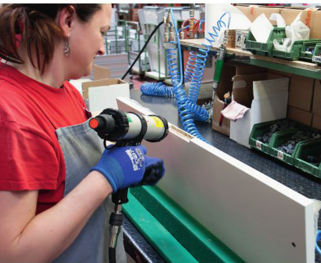
Слева: готовую панель обрабатывают силиконом, чтобы защитить от влаги.