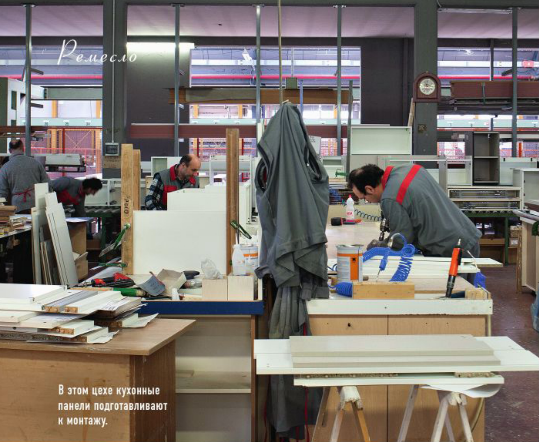
В этом цехе кухонные панели подготавливают к монтажу.

> и специальный отдел, изготавливающий гарнитуры нестандартных размеров.