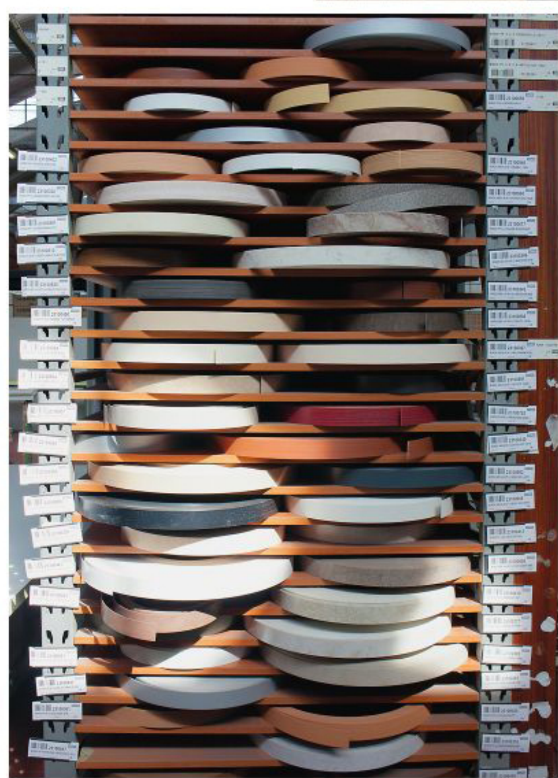
Бобины шпона для обработки кромки.