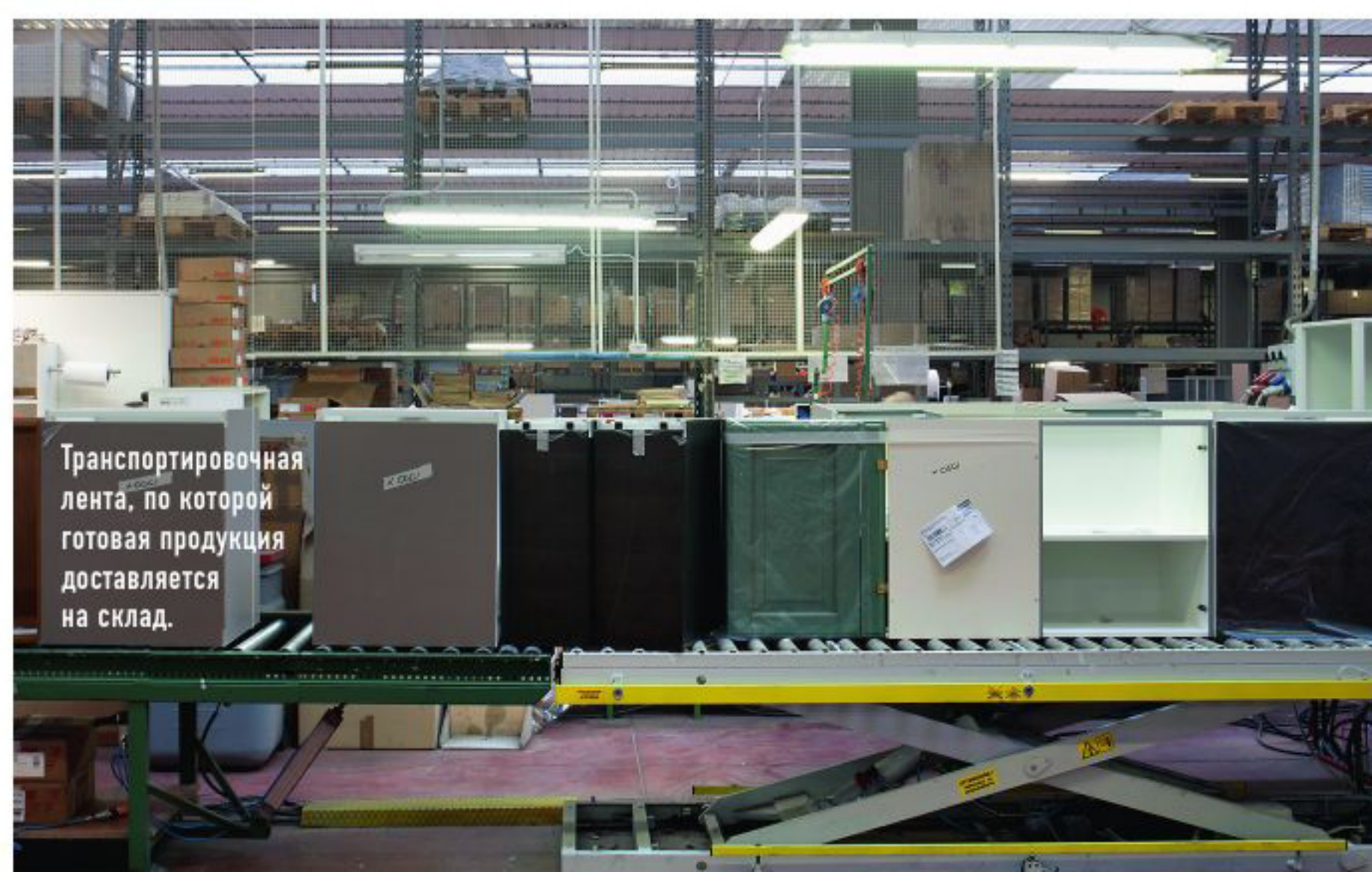
Транспортировочная лента, по которой готовая продукция доставляется на склад.