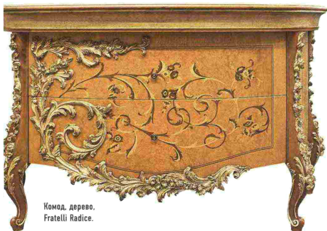
Комод, дерево, Fratelli Radice.