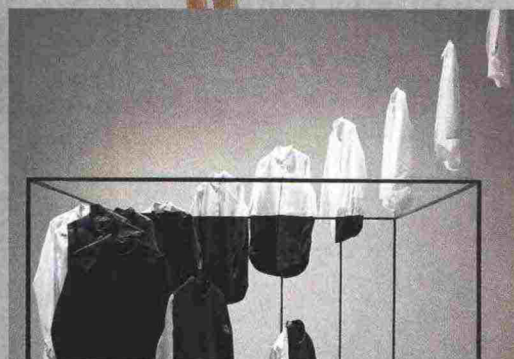
Инсталляция для фэшн-бренда Sos в рамках Миланской недели дизайна.