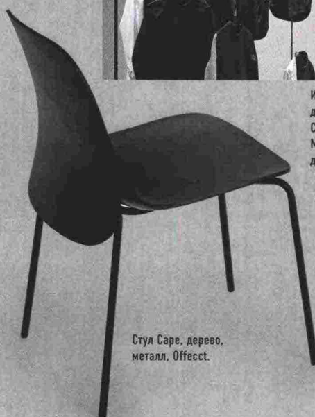
Стул Саре, дерево, металл, Offecct.