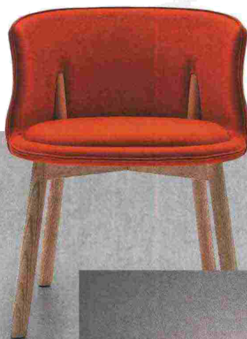
Кресло из коллекции Reg, дерево, текстиль, Cappellini.