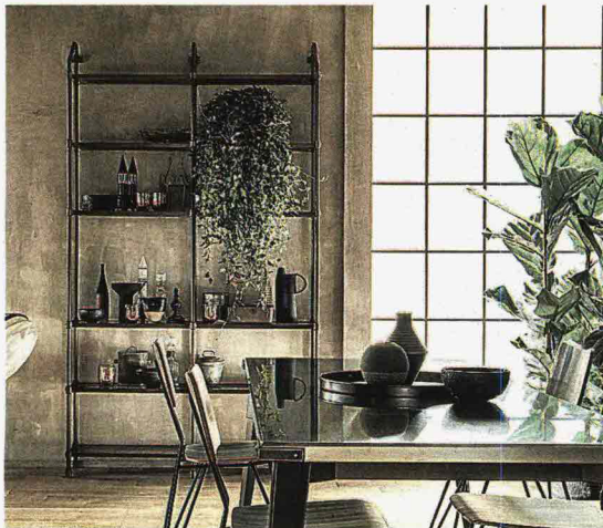
Tre immagini degli interni dell' Open Workshop , l'innovativo progetto realizzato da Scavolini in collaborazione con Diesel per gli ambienti cucina e bagno. In alto, il sistema Stock Rack , mensole a giorno di ispirazione industriale come tutto il sistema; in alto a destra, un approccio caldo domestico e, qui accanto, una composizione lineare